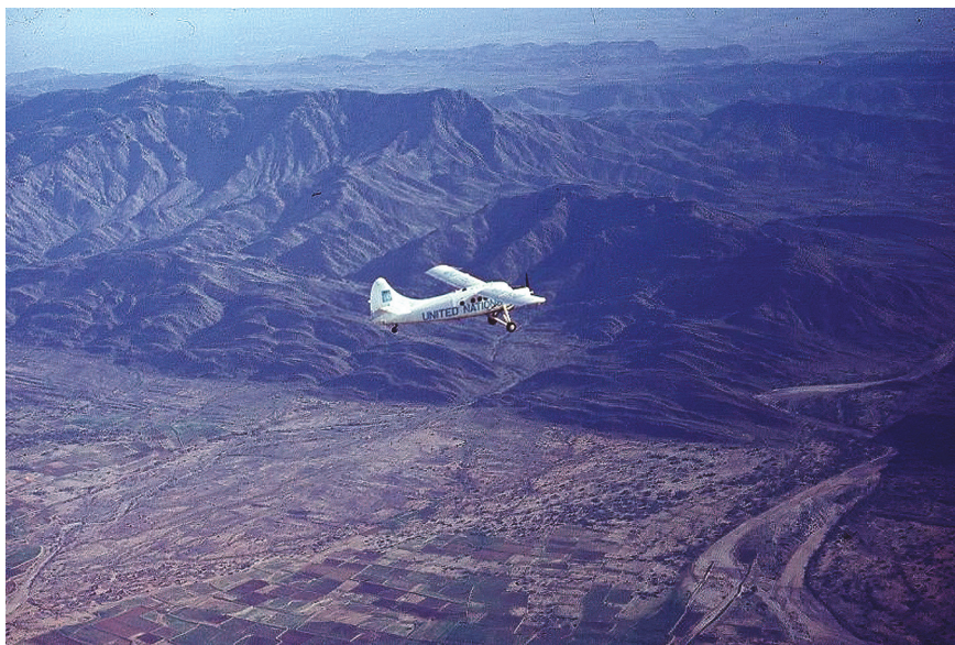
Воздушни патроли со летови над јеменско-саудиската граница. ( http://www.115atu.ca/Photos/gm/gm07.jpg ).