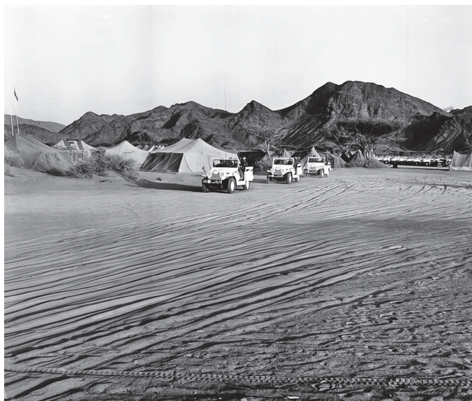
Патрола на Одредот во главната база во Најран, ( https://dam.media.un.org ), 50