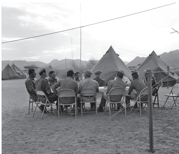
Состанок во Најран меѓу саудиските офицери и претставниците на Одредот, ( https://dam.media.un.org ). 51