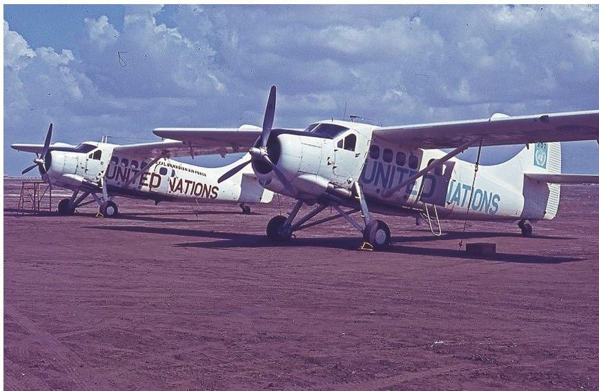
Воздухопловната база на канадската воздухопловна единица во Јизан, Саудиска Арабија. ( http://www.115atu.ca/Photos/gm/gm29.jpg ).