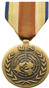
Медалот на ООН за служба во мисијата UNYOM. ( https://bigburymint.com/product/un-yemen-observation-mission-unyom-full-size/ ).