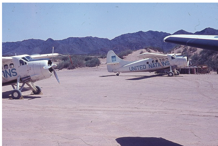
Воздухопловната база на канадската воздухопловна единица во Најран, Саудиска Арабија. ( http://www.115atu.ca/Photos/gm/gmo4.jpg ).